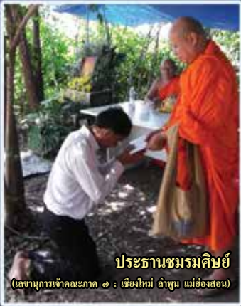
ประธานชมรมศิษย์ (เลขานุการเจ้าคณะภาค ๑ : เชียงใหม่ ลำพูน แม่ฮ่องสอน)