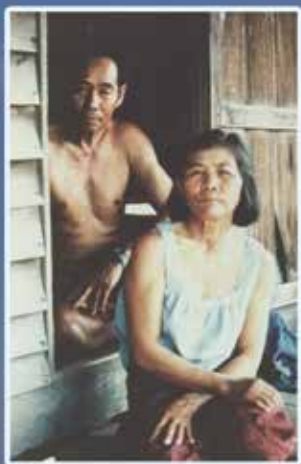
พ่อและแม่

(เกษตรกร แม่ค้า ศิลปิน และปราชญ์ชาวบ้าน)