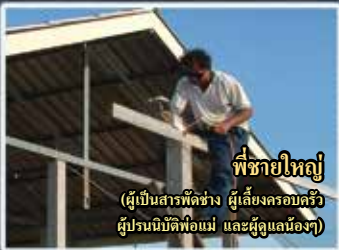
พี่ชายใหญ่ (ผู้เป็นสารพัดช่าง ผู้เลี้ยงครอบครัว ผู้ปรนนิบัติพี่พ่อแม่ และผู้ดูแลน้องๆ)

เพราะอยู่มา ๕๐ ปี นี้เกินคาด เคยใจขาด ตายแล้วฟื้น คืบหลายหน กายซีโรด ใจชี้แจง แยมเต็มทน ยังอยู่จน ถึงวันนี้ แผลกดตีนัก