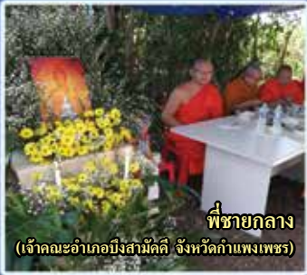
พี่ชายกลาง (เจ้าคณะอำเภอเมืองสามัคคี จังหวัดกำแพงเพชร)